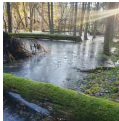
Kommunen har anlagt flera våtmarker i skog under åren, flera mindre våtmarker i Runbyskogen och Sättra Gårds naturreservat, se bild.

Skötseln av skogarna i Upplands Väsby behöver reformeras så att skogarna förmår att bevara rödlistade arter och stärka den biologiska mångfalden samt att skogarna också snabbt ökar kolinlagringen för att hejda klimatkrisen. Naturskyddsföreningen Väsby har framfört flera förslag om skogarna i kommunen. Förslagen riktar sig till kommunen men kan också ses som rekommendationer för skogsägare och skogsförvaltare. De är beskrivna i Naturskyddsföreningens 60 förslag för en bättre miljökommun.