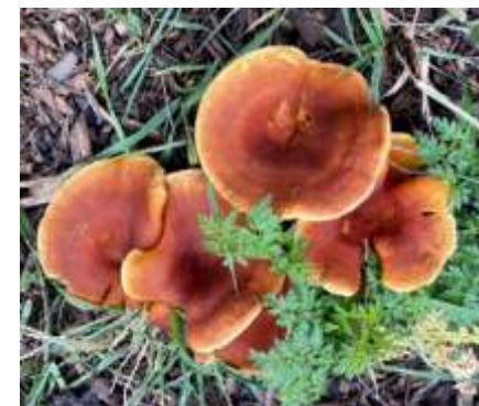
Skogens är inte bara träd. Foto: Mörk trattkantarell. Niklas Johansson