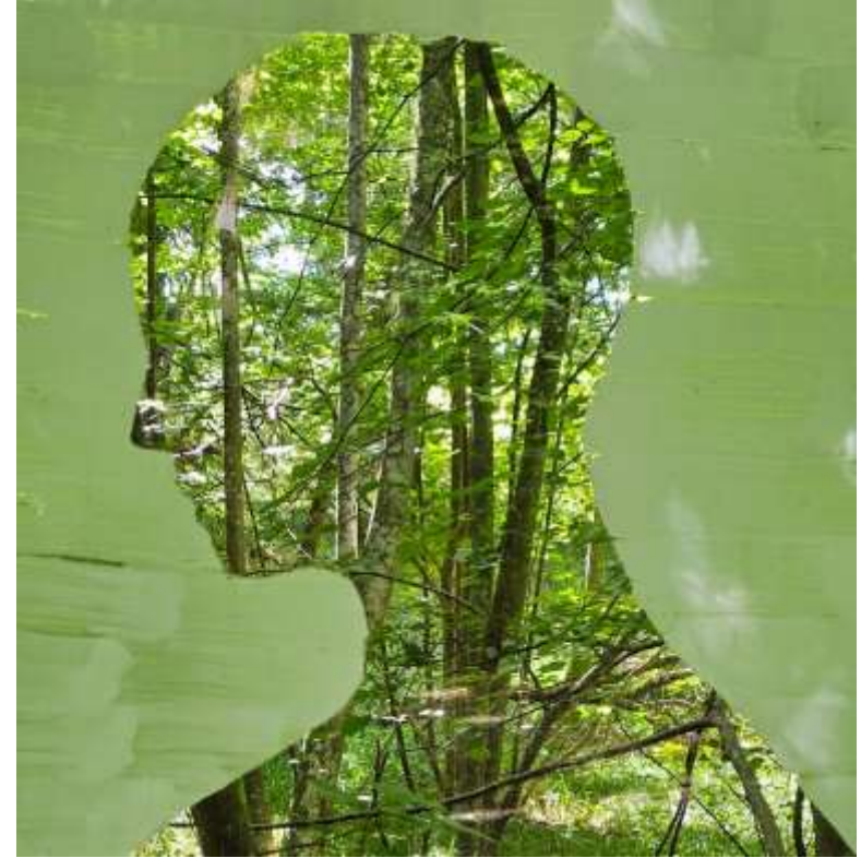
Bild: Våryra, verk av Helene Vejrich i Skulpturskogens utställning POETISKA EKON, Café Villa Ed.

Skogen andas djupt och långsamt Den fyller luften med syre och doft Den ger liv åt djur och växter Och skydd åt dem som söker tröst