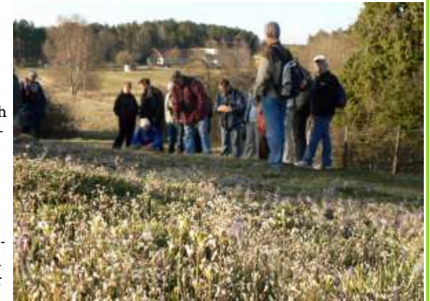
Calmare hagen har vi räddat med en restaurering under 25 år. Nu sköter kommunen hagen.

Klimat, skog, jordbruk, miljögifter, vatten, hav och hållbar konsumtion är våra viktigaste arbetsområden. Bra Miljöval är vår miljömärkning och Sveriges Natur vår medlemstidning. Sedan 1909 har Naturskyddsföreningen varit med och räddat pilgrimsfalken, skapat naturreservat, bidragit till ekoboomen och påverkat viktiga politiska beslut, bland annat inom klimatområdet. I Upplands Väsby har vi räddat ängar, hagar och hotade arter och bidragit till att mer värdefull natur finns kvar.