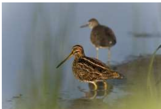
Enkelbeckasin. O Runfors

Vi besöker grannkommunen i väster och Natura 2000 naturreservat Broängarna. 250 hektar vatten och strandängar. Strandängarna hålls dessutom hävdade genom bete. 80 fågelarter häckar regelbundet inom området och till detta kommer varje år många flyttande arter. Särskilt en rad olika vadare sätter då sin prägel på området. Här anses Storspoven ha haft sin sista häckning inom länet. Har vi tur får vi höra Enkelbeckasinens speciella vårspele.